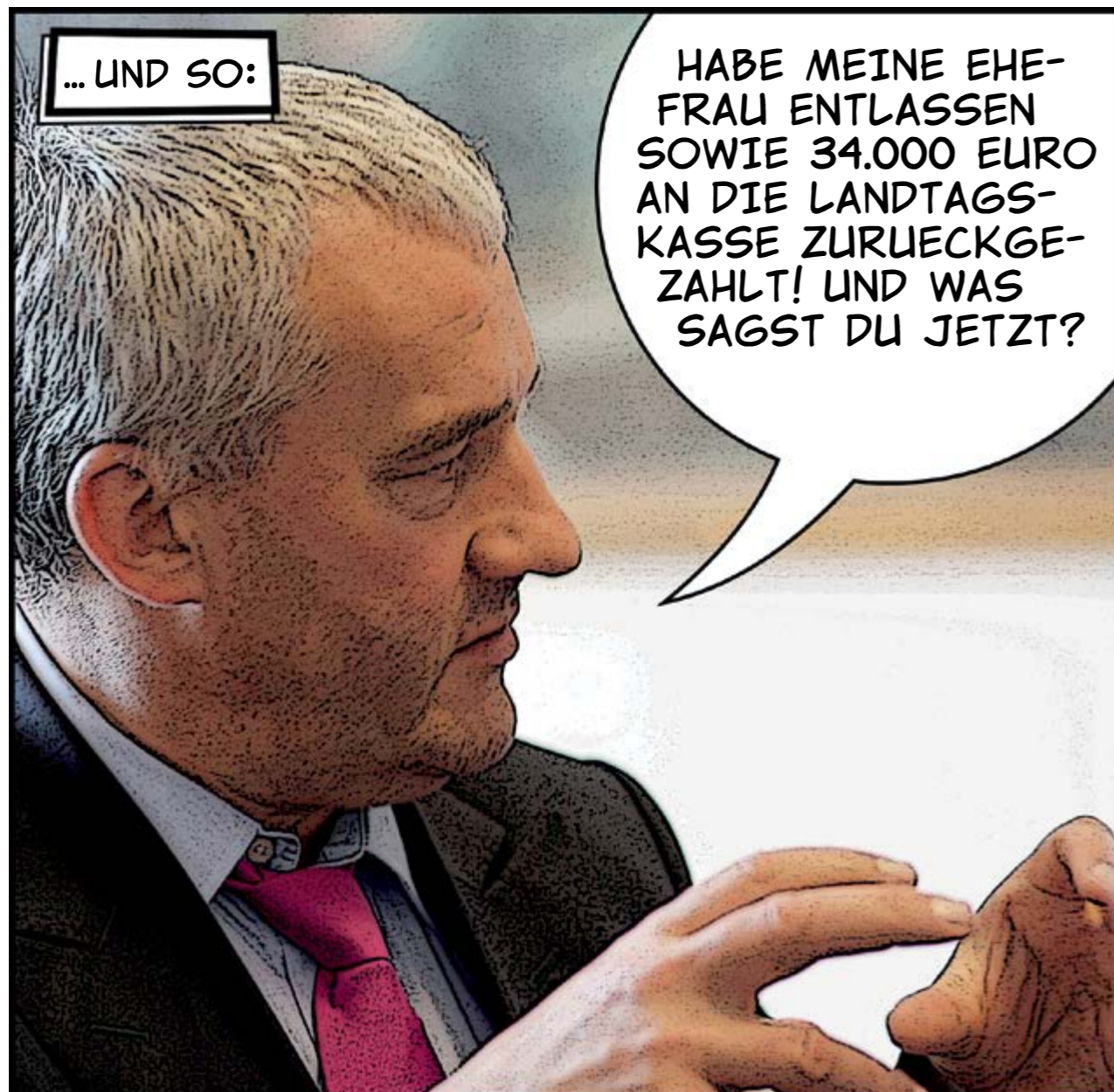
Dr. Ludwig Spaenle, seit 10|2013 »Superminister«: Bayerischer Staatsminister für Bildung und Kultus, Wissenschaft und Kunst.