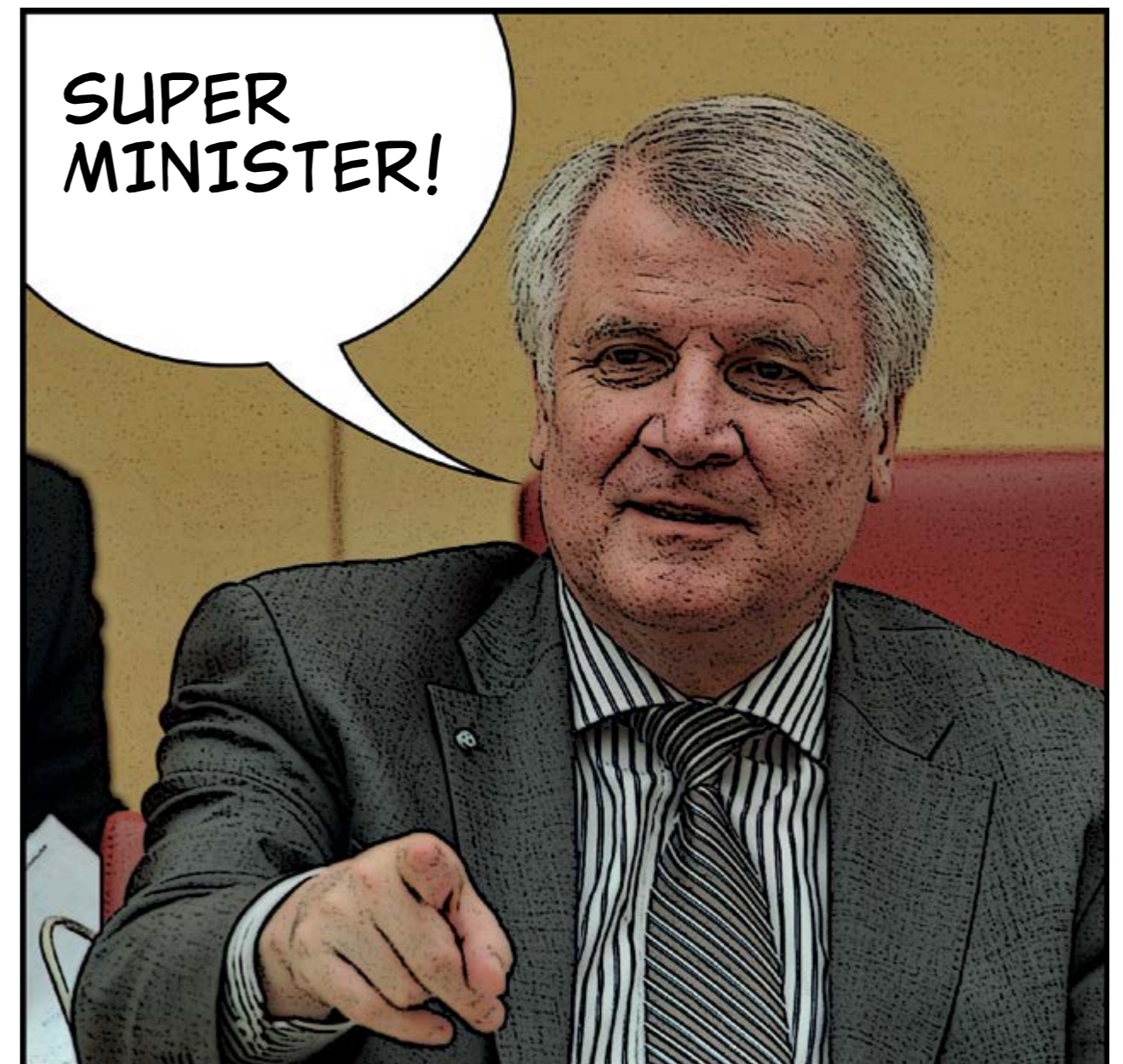
© Text und Comic, Dominik Mischko.